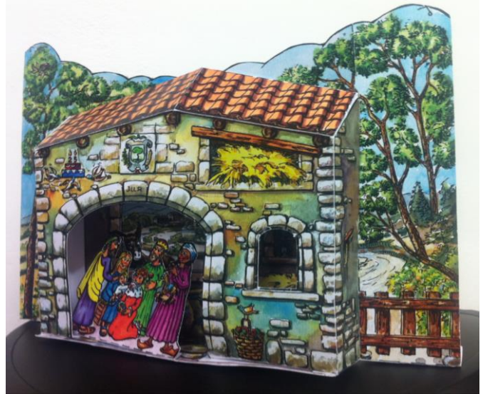
Per alumnes de 1r ESO.

SI NO US PODEU APROPAR AL MUSEU A FER EL TALLER, TENIU LA POSSIBILITAT D'ADQUIRIR AQUEST REBALLABLE AL PREU D' 1 EURO COMANDES AL MUSEU BÍBLIC TARRACONENSE (Tel. 977 25 18 88/ museu.biblic@arquebisbattarragona.cat )