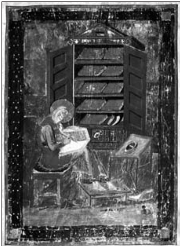
Esdres. Còdex Amiatinus, Biblioteca Medicea Laurenziana, Florència.

des d'una perspectiva pedagògica, insistirem en la humilitat en tractar la primera part de l'oració d'Esdres (Esd 9,5-15) i ens centrarem en el compromís quan ens apropem a la segona part (Ne 8,1-12).