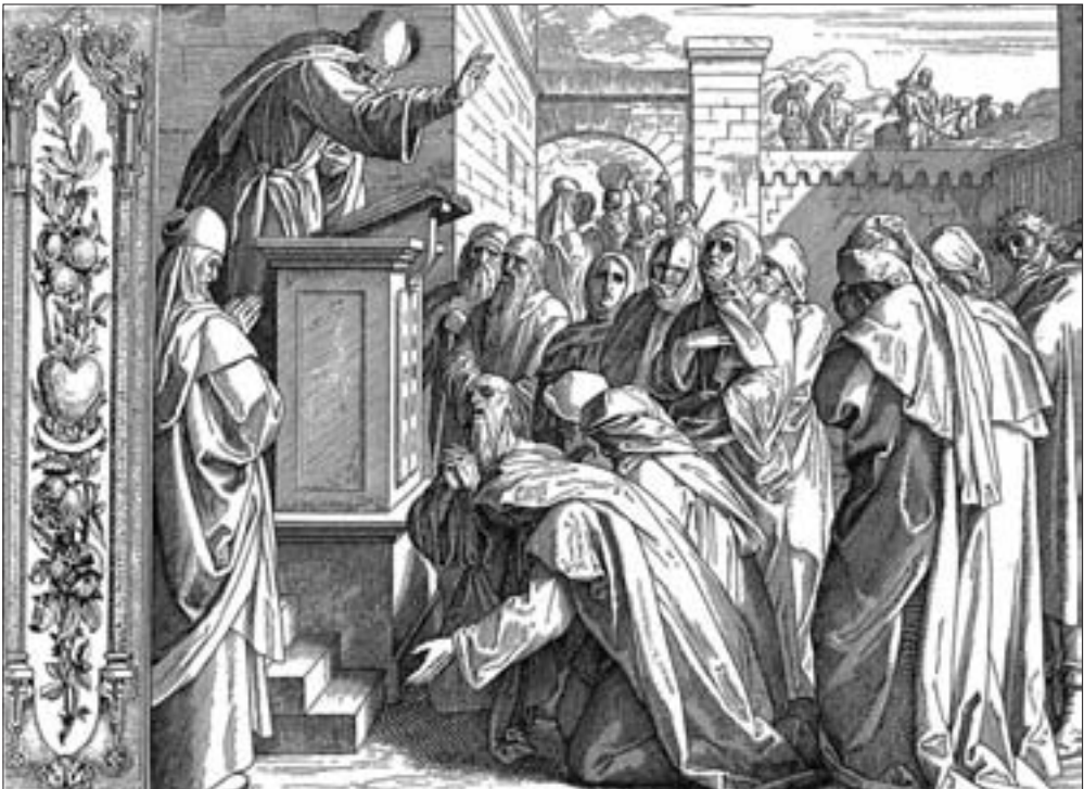
Esdres. Julius Schnorr (1794-1872).

Davant la comunitat reunida, Esdres llegeix el llibre de la Llei de Moisès des del matí fins al migdia. El text subratlla la majestuositat de la lectura. Esdres estava dempeus sobre una tarima de fusta aixecada expressament, obrí el llibre a la vista de tot el