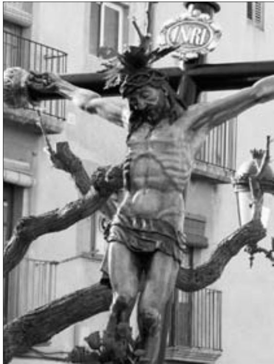
En la creu Déu reconciliava amb ell mateix el món.

És una pau que, com en l'Antic Testament, brolla d'un do global de Déu, perquè la salvació del poble es realitza —i de manera radical— a través del perdó dels pecats (cf. Mt 1,21). En terminologia paulina, es tracta de la justificació prèvia i gratuïta dels qui formem part d'aquest món pecador. La pau doncs és obra de l'acció gratuïta de Déu per mitjà de l'amor sense límits —redemptor (cf. Rm 3,24)— del seu Fill en la creu (cf. Rm 3,21-26), que ens fa capaços de poder respondre, per la fe, a aquest amor gratuït, estimant els altres tal com ens estimem a nosaltres mateixos (cf. Rm 13,8-10). En la creu Déu reconciliava amb ell mateix el món (cf. 1Co 5,17-21). I si nosaltres