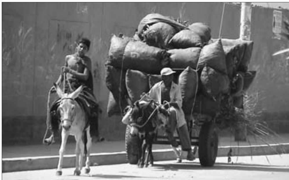
Humilment, muntat en un ase.

misteriosa del «Servent del Senyor), i que el Nou Testament veurà encarnada en Jesús (cf. Is 42,1-9 i 52,13-53,12 que apareixen esmentats en Mt 8,6-17 i 12,15-21).