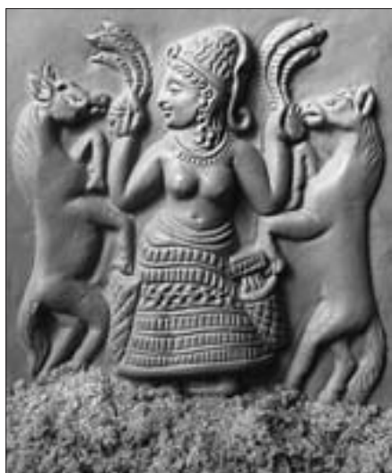
Astarté, deessa fenícia de la fecunditat i de l'amor.

3. Moisès denega la possibilitat als alliberats d'Egipte de contreure matrimoni amb els cananeus. El precepte reposa en motius religiosos i és la conseqüència de la prohibició d'establir aliances amb els cananeus. A tenor de la mentalitat antiga, quan un rei