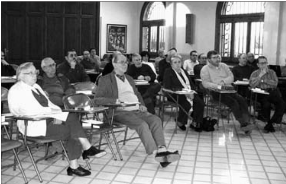
Alguns dels assistents a les Jornades escoltant una conferència.